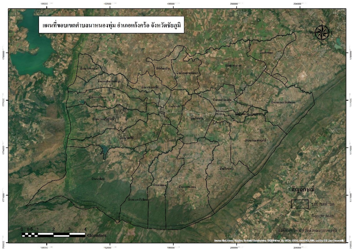
ภาพถ่ายทางอากาศตำบลนาหนองท่อม